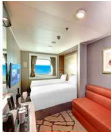
Oceanview Stateroom with Window