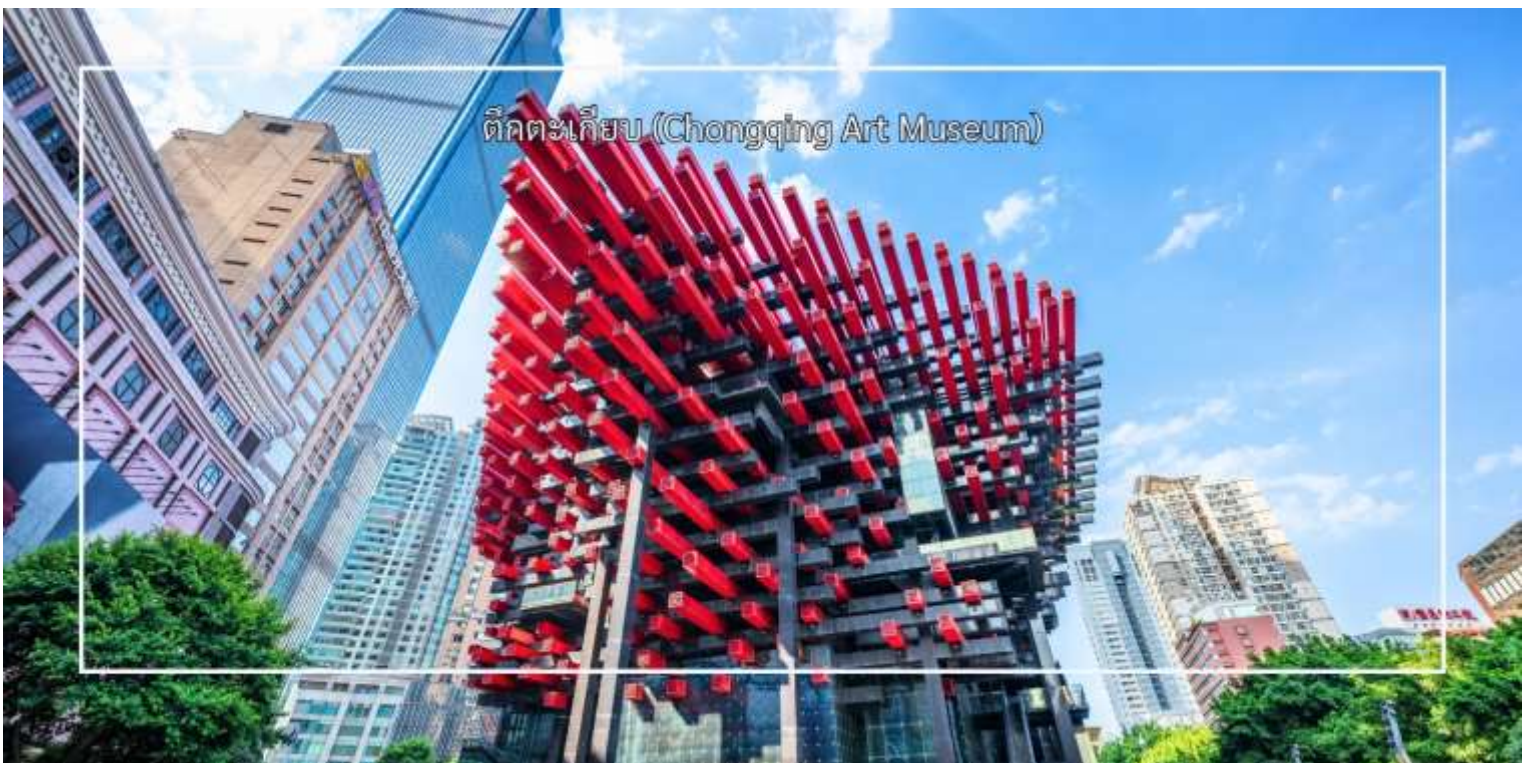
ตึกตะเกียบ (Chongqing Art Museum)

นำท่านสัมผัสความสวยงามของ ตึกตะเกียบ (Chongqing Art Museum) แลนด์มาร์คสุดแปลกตาใจกลางเมือง ที่ออกแบบอาคารให้มีลักษณะคล้ายตะเกียบยักษ์สีแดง-ดำซ้อนกันอย่างโดดเด่น อาคารแห่งนี้เป็นที่ศูนย์จัดแสดงศิลปะร่วมสมัยและจุดถ่ายภาพยอดนิยมของนักท่องเที่ยว ด้วยดีไซน์ทันสมัยและเอกลักษณ์เฉพาะตัว ทำให้ที่นี่กลายเป็นหนึ่งในสถานที่ที่ต้องมาเยือน