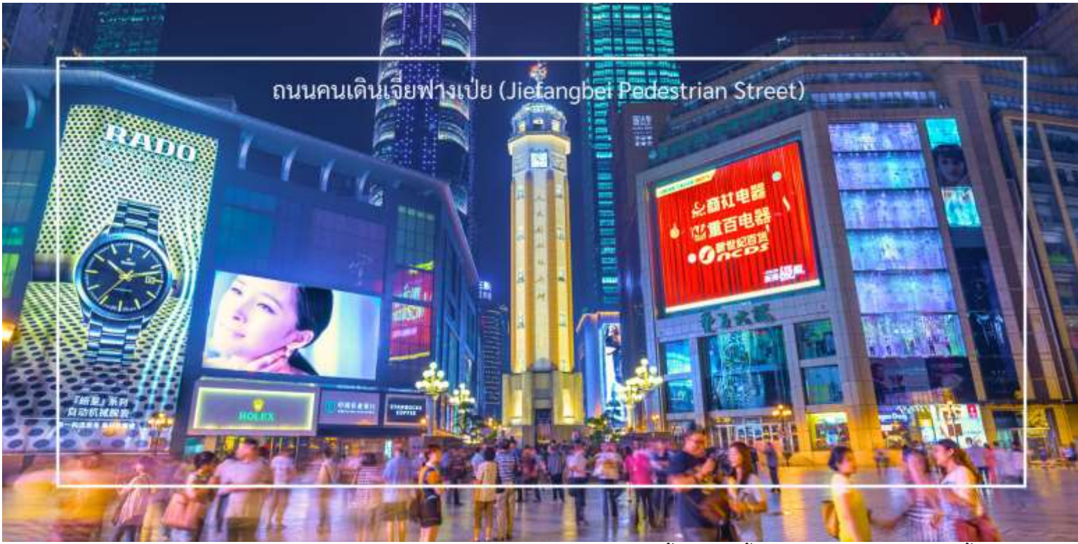
ถนนคนเดินเจี๋ยฟางเป่ย์ (Jiefangbei Pedestrian Street)

นำท่านชม ตึกไควชิงโหล (Kuaiqinglou) ตึกสุดแปลก เดินทางจากชั้น 1 เป็นชั้นที่ 22 แลนด์มาร์กสำคัญที่ตั้งตระหง่านอยู่ใจกลางเมืองฉงชิ่ง โดดเด่นด้วยสถาปัตยกรรมสูงสง่าที่ผสมผสานความทันสมัยเข้ากับเสน่ห์ของวัฒนธรรมท้องถิ่นอย่างลงตัว จากชั้นบนสุดของตึกสูง 22 ชั้นแห่งนี้ ท่านจะได้สัมผัสกับทัศนียภาพสุดตระการตาแบบพาโนรามา 360 องศา ทั้งแม่น้ำแยงซีที่ทอดยาวคดโค้งไปท่ามกลางภูเขาสูง และภาพเมืองฉงชิ่ง