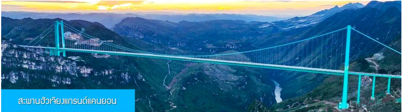
สะพานฮัวเจียงแกรนด์แคนยอน

รับประทานอาหารเช้า ณ ภัตตาคาร (มื้อที่ 7)