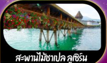
สะพานไม้ชาเปล คูซีน