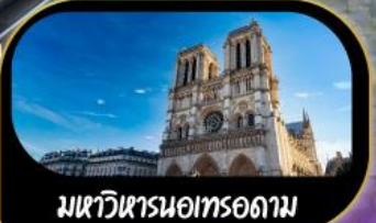
มหาวิหารนอทรอดาม