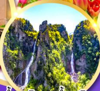
น้ำตกกิงกะ-น้ำตกริวเซ