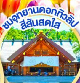
ชมอุทยานดอกทิวลิป สีสันสดใส