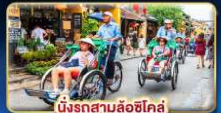
นั่งรถสามล้อฮิโค่