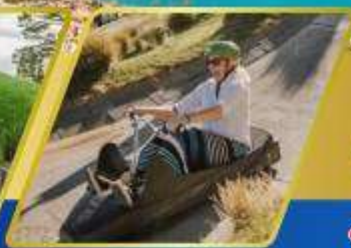
เล่นลู่ที่ควีนส์ทาวน์

AUCKLAND / ROTORUA / CHRISTCHURCH FOX GLACIER / FRANZ JOSEF / QUEENSTOWN