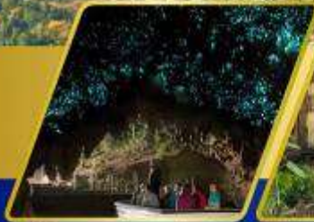
ถ้ำหอนเรื่องแสง