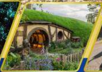
หมู่บ้านฮ็อบบิต