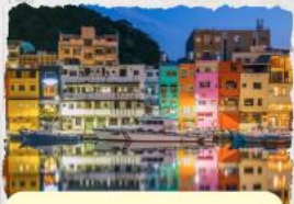
ทะเลสุริยขึ้นฉันทรา