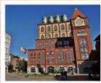
โรงงานเบียร์ชิงเต่า