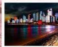
หาดโซเบอร์ NO.3