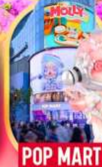
ช้อปปิ้งถนนหนางจิง