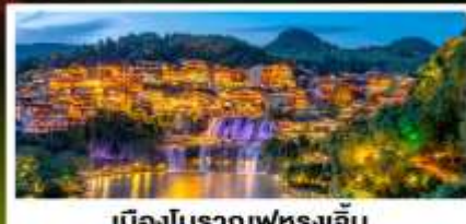
เมืองโบราณฟุทงเจิ้น