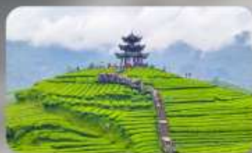
กูเจาไร่ซาอูเจียโก