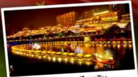
เมืองโบราณเซียนเิน