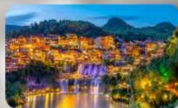
เมืองโบราณฟุทงเจิน