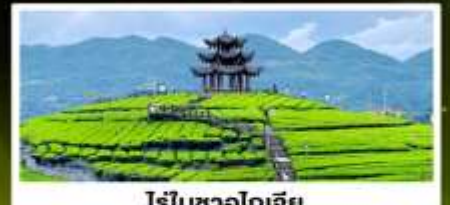
ไร่ชาอูโตเจี๋ย