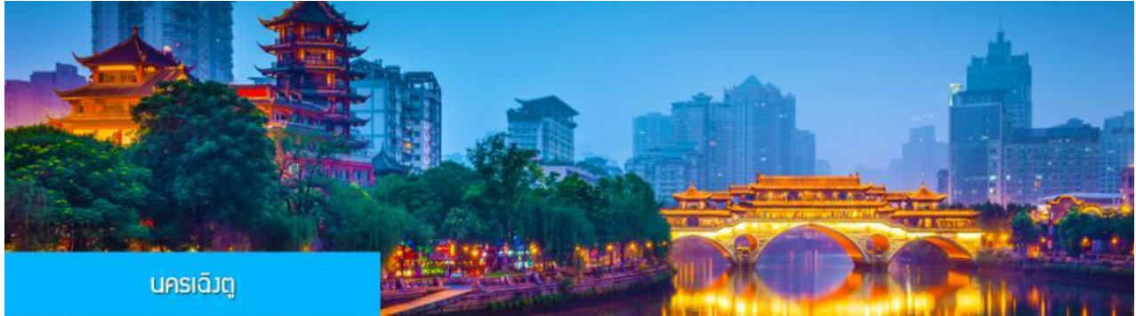
นครเจียงตู