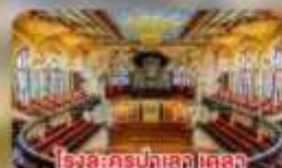
โรงละครบัลเลต์ เดลลา มูสิกกา คาตาลา