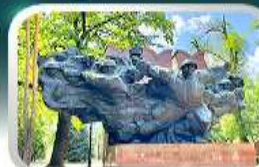
Panfilov Guardsmen Park