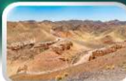
ชารินแกรนด์แคนยอน