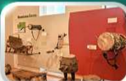
Museum of Folk Instrument