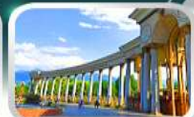
1st President Park