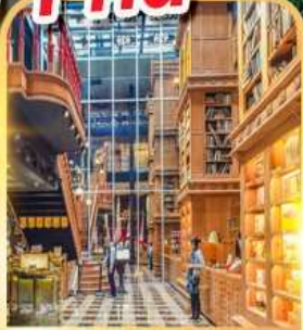
ร้านไอศกรีมมियाฮาร่า