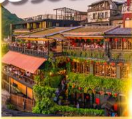
หมู่บ้านโบราณจิว่เฟิ่น