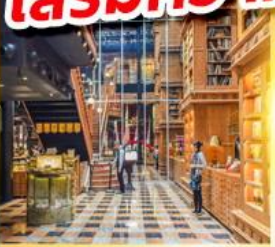
ร้านไอศกรีมมียาฮารา