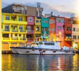
ท่าเรือประมงเจิ้งปิ่น