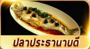
ปลาประธานาธิบดี