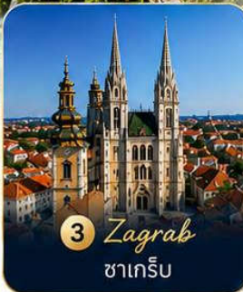
3 Zagreb ซาเกร็บ