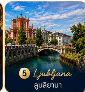
5 Ljubljana ลูบลิยานา