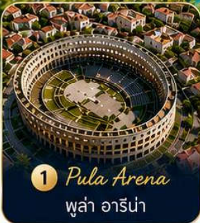
1 Pula Arena ปูลา อาร์น่า