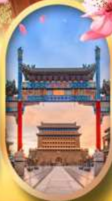
ถนนคนเดินเจียมเหมิน