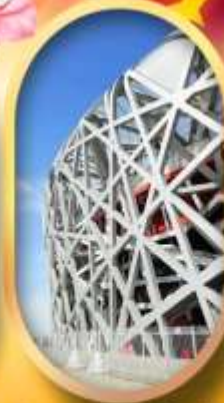
ผ่านชมสนามกีฬาโอลิมปิก