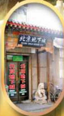
เมืองโบราณใต้ดิน