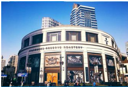
Starbuck Reserve Roastery

รับประทานอาหารกลางวัน ณ ภัตตาคาร *เมนูเดียวหลงเป่า (2)