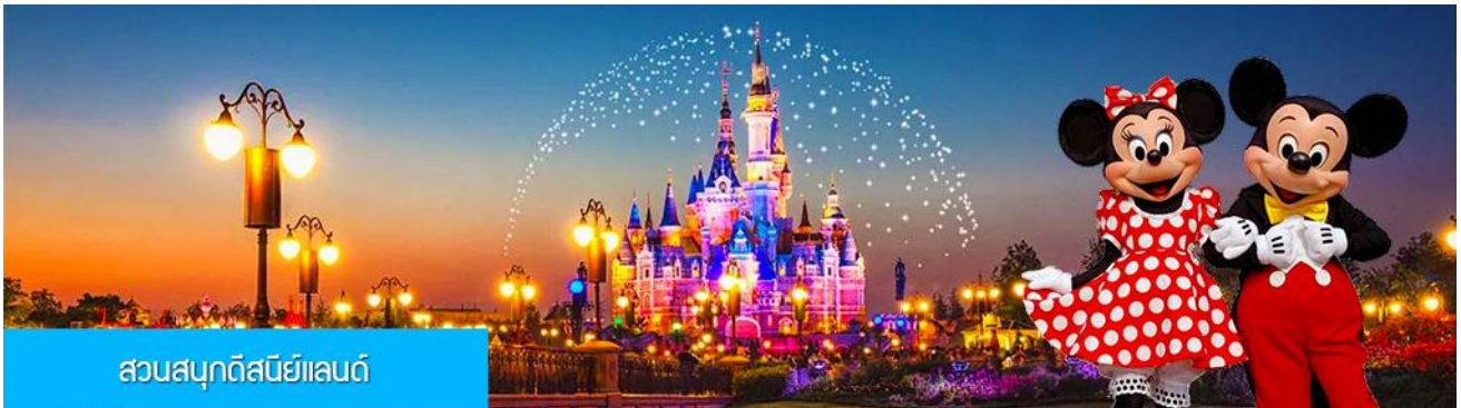
สวนสนุกดิสนีย์แลนด์

พักที่ โรงแรม Tongpai Hotel or Fangyi Hotel 4* หรือเทียบเท่าในเมืองเชียงใหม่