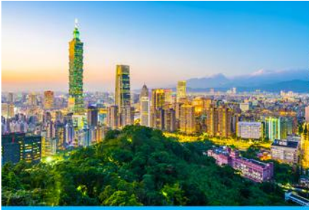
เมืองหวงซาน