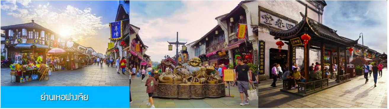
ย่านเหอฝางเจีย