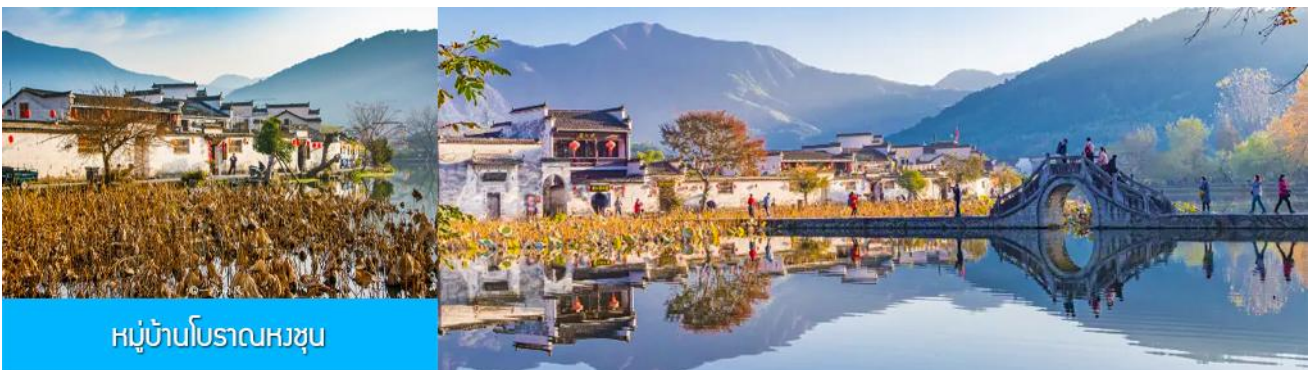
หมู่บ้านโบราณหงซุน

ไกด์ท้องถิ่นนำเสนอโปรแกรมทัวร์เสริมบัตรชมการแสดงชุด ตำนานรักเมืองซ่ง 宋城千古情 การแสดงภายในโรงละครที่ดีที่สุด และได้รับรางวัลมากที่สุดของประเทศจีน.....อัตราค่าบริการสำหรับโปรแกรมเสริม ท่านละ 380 หยวนหรือ 1,900 บาท ใช้เวลาประมาณ 90 นาที ค่าบริการรวม ค่าตัวชมการแสดง ค่ารถบัสรับ และค่าน้ำดื่มของไกด์ท้องถิ่น