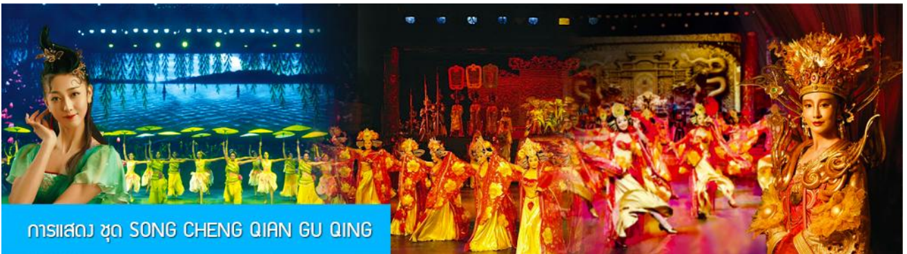
การแสดง ชุด SONG CHENG QIAN GU QING

พักที่ โรงแรม VIENNA HOTEL หรือเทียบเท่าในเมืองหังโจว