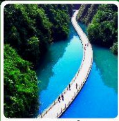
หุบเขาสิงโต