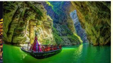
แกรนด์แคนยอนผิงซาน

*ทางบริษัทฯ ขอสงวนสิทธิ์ในการสลับโปรแกรมทัวร์ตามความเหมาะสมขึ้นอยู่กับสถานการณ์หน้างาน โดยคำนึงถึงผลประโยชน์ของลูกค้าเป็นสำคัญ