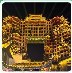
ตึกหัตถกรรม 72

• ไฮไลท์ อุทยานเทียนเหมินซาน ประตูลั่วจื่อ ตึกหัตถกรรม 72 หมู่บ้านโบราณฟูหลงจีน ภูเขาไร่ชาอู่จี้ไฮโด อุทยานสื่อจื่อจกวนด่านสิงโต