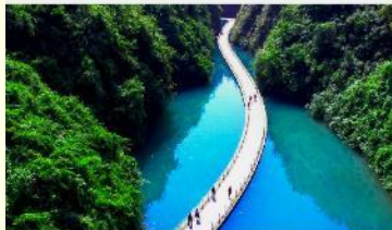
ขุนเขาสิงโต