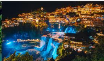
หมู่บ้านโบราณผู้หลงเจิน