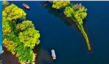
อ่าวพระจันทร์