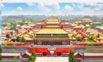
พระราชวังต้องห้ามปักกิ่ง

*ทางบริษัทฯ ขอสงวนสิทธิ์ในการสลับโปรแกรมทัวร์ตามความเหมาะสมขึ้นอยู่กับสถานการณ์หน้างาน โดยคำนึงถึงผลประโยชน์ของลูกค้าเป็นสำคัญ