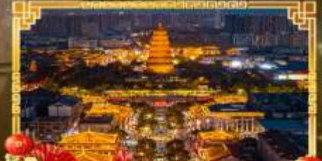
ถนนคนเดินราชวงศ์ถัง