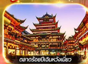
ตลาดร้อยปีเงินหวงเหมียว

เที่ยวดิสนีย์แลนด์เต็มวัน (รวมบัตร + รถรับส่ง) ช้อปปิ้งย่านดัง นานกิง, เงินหวงเหมียว