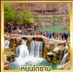
หยุ่นโกซาม