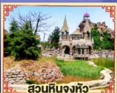
สวนหินงูหัว