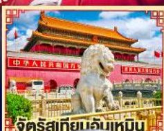
จัตุรัสเทียนจันเหมิน