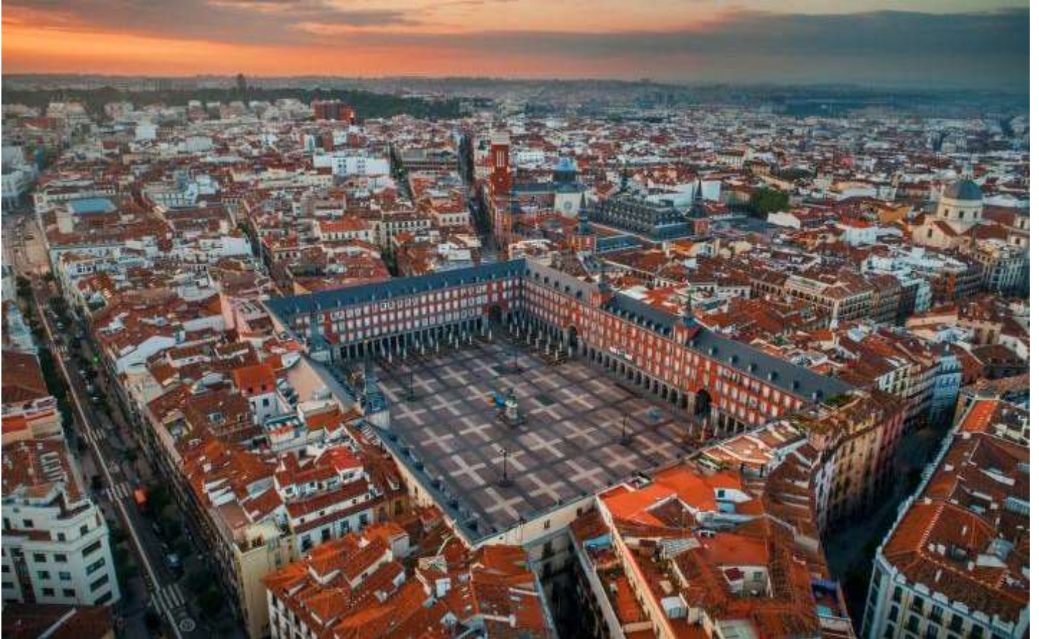
เย็น รับประทานอาหารเย็น ณ ภัตตาคาร

อิสระทุกท่านที่ จัตุรัสพลาซา มายอร์ (Plaza Mayor) จัตุรัสประวัติศาสตร์ใจกลางกรุงมาดริด สร้างขึ้นในคริสต์ศตวรรษที่ 17 เคยใช้เป็นสถานที่จัดพระราชพิธี งานเฉลิมฉลอง และกิจกรรมสำคัญของเมืองในอดีต ปัจจุบันเป็นจุดศูนย์รวมของชีวิตชาวมาดริดและนักท่องเที่ยว จัตุรัสแห่งนี้รายล้อมด้วยอาคารสถาปัตยกรรมสเปนดั้งเดิม โดดเด่นด้วยระเบียงและซุ้มโค้งอันเป็นเอกลักษณ์ บรรยากาศคลาสสิกและคึกคัก เหมาะแก่การเดินเล่น พักผ่อน อีกทั้งบริเวณโดยรอบรายล้อมด้วยร้านอาหาร คาเฟ่ และ ร้านค้าของที่ระลึก จำหน่ายสินค้าพื้นเมือง งานหัตถศิลป์ ของฝาก และสินค้าที่สะท้อนเอกลักษณ์ของสเปน อีกทั้งยังเชื่อมต่อกับถนนสายช้อปปิ้งในย่านเมืองเก่า ให้ท่านอิสระเดินเล่นเลือกซื้อสินค้า และถ่ายภาพท่ามกลางบรรยากาศคลาสสิกอันมีเสน่ห์ของกรุงมาดริด