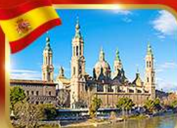
วิหารพระแม่มารีย์ ซาราโกซา