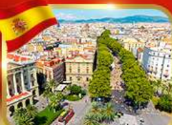
ลาร์บบลาสตริก บาร์เซโลนา