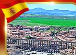
เที่ยวเมืองมรดกโลก ซโกเวีย