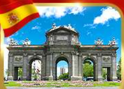
เขื่อนประตูอิตาลี มาดริด