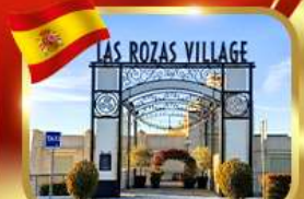
Las Rozas Village ฮากาเลีย