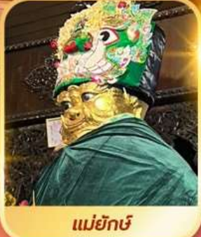
แม่ยักษิ์