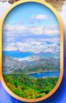
ทะเลสาบมิกะตะ