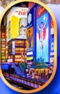
ย่านชิบะฮาชิจิ