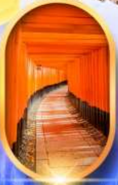
เมืองเก่าทาคายาม่า