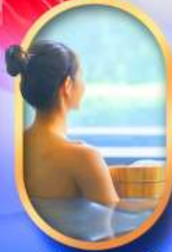
พักโรงแรมออนเซ็น