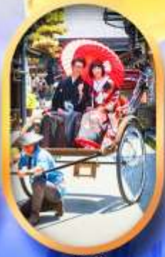
ศาลเจ้าจิ้งจอก