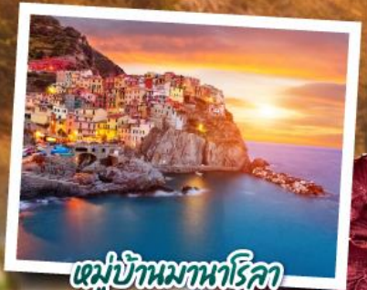
หมู่บ้านมานาโรคา