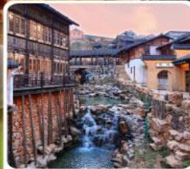
เมืองโบราณเหยahu