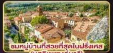
ชมหมู่บ้านที่สวยงามที่สุดในฝรั่งเศส (มูสดีเยแซงมาร์)