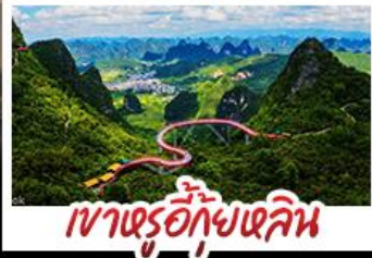
เขาต๋ออี๋กุ้ยหลิน