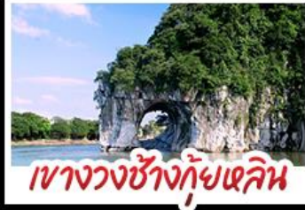
เขาวงกตช้างกุ้ยหลิน

สองเรือแม่น้ำที่จียง สวนสตรอว์เบอร์รี่ ทัศนียภาพที่สวยงาม นั่งบอลูนชมวิว 360 องศา ทางวงช้างกุ้ยหลิน ทำฝู้อ้อ พาหุจี้ เมืองกุ้ยหลิน รถไฟความเร็วสูง พักโรงแรมระดับ 5 ดาว เมบูอาหารพิเศษ POP MART