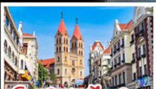
โบสถ์เซนต์ไมเคิล