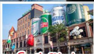
โรงแรมเป่ย์ชิ่งเต่า