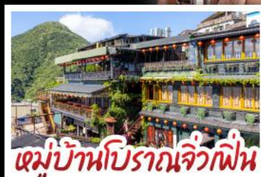
หมู่บ้านป๊อปรานจิ๋วเฟิน