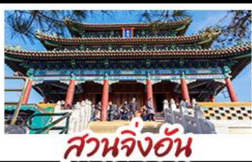
สวนจิ้งอัน