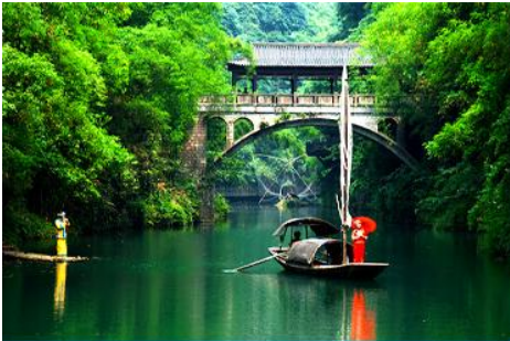
หมู่บ้านชาบลี

พักที่ YICHANG HUIHAO HOTEL โรงแรมระดับ 4 ดาวหรือเทียบเท่าในเมืองหยี่ชาง