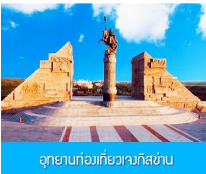
อุทยานทองเทียวเจงกิสข่าน

รับประทานอาหารกลางวัน ณ ร้านอาหารพื้นเมืองในเขตอุทยาน (11)