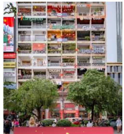
The Cafe Apartment.

ที่พัก Sai Gon Emerald ระดับ 4 ดาวท้องถิ่นหรือเทียบเท่า