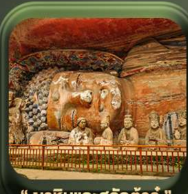
“ พาหินแคะสลักต้าจู้ ”

วันเดินทาง มี.ค. - ต.ค.2569 ราคาเริ่มต้น 22,999.-