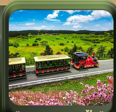
“ อุทยานเขานางฟ้า ”

T2G-CKG26CZ Special of Chongqing... วงชิง ต้าจู้ อุโมงค์ อุทยานหลุมฟ้า เขานางฟ้า 5D 3N (CZ)