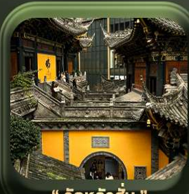
“ วัดหลว้ออัน ”