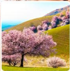
ทุ่งดอกอัลมอนต์