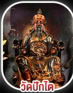
วัดบิกิต