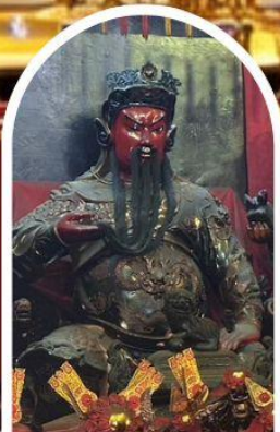
วัดกวนไท่ ขอเทพเจ้ากวนอู ความซื่อสัตย์ เงินทอง ธุรกิจมั่นคง