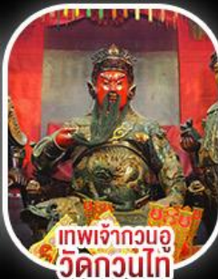
เทพเจ้ากวนอู วัดกวนไท