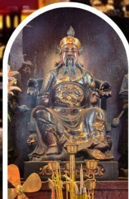
วัดปักไต้ เสริมโชคกลางนำความรุ่งเรืองทุกด้านของชีวิต