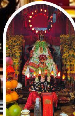
วัดเจ้าแม่กวนอิมอ่องฮำ ขอพรเรื่องเงิน ทรัพย์สิน และความมั่งคั่ง