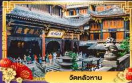
วัดหลัวหนาน