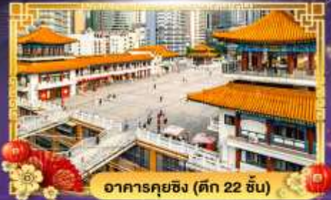
อาคารคุยซิง (ตึก 22 ชั้น)