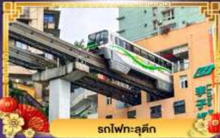
รถไฟฟ้า-ลู่ตัก