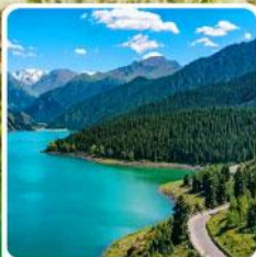
อุทยานเทียนชาน เทียนฉือ