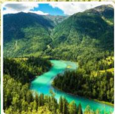
ทะเลสาบคานาสีอ