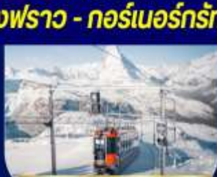
กอร์เนอร์กรัท