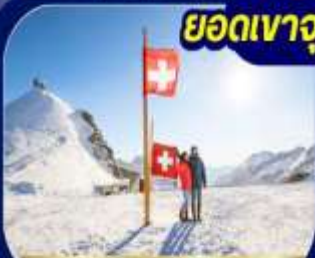
ยอดเขาวงพร้าว