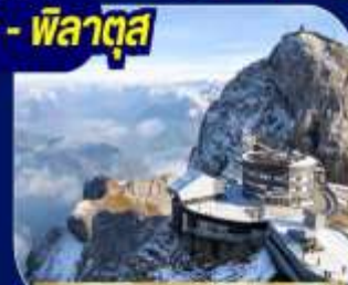
ยอดเขาพิลาตุส

นั่งรถไฟ Bernian Express เส้นทางรถไฟสายมรดกโลก