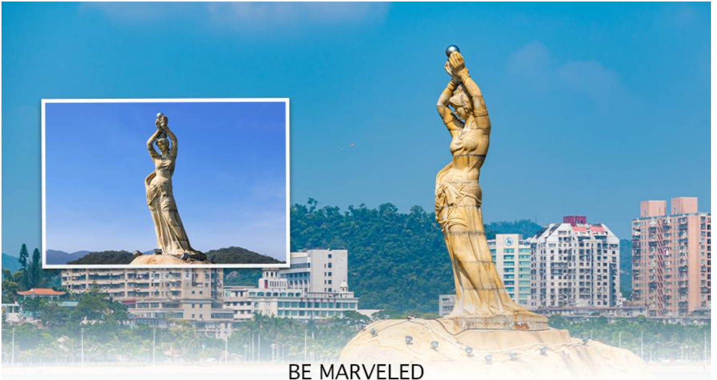
BE MARVELED จุฬารัชมังคลาจารย์