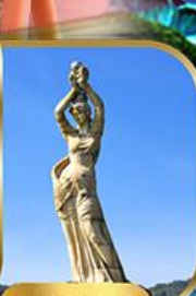
จูไห่ฟิชชอร์ทิวรา