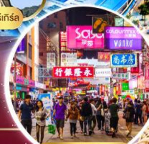
Shopping Tsim Sha Tsui