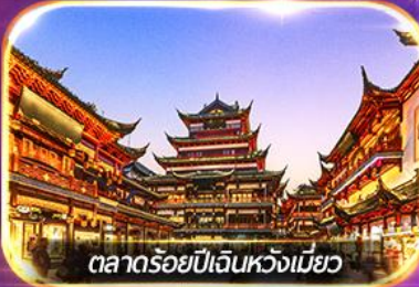
ตลาดร้อยปีเงินหวงเหมียว