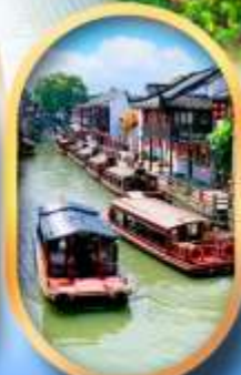
ถนนชานกิ่งเจีย