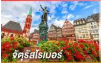
จัตุรัสโรเมอร์