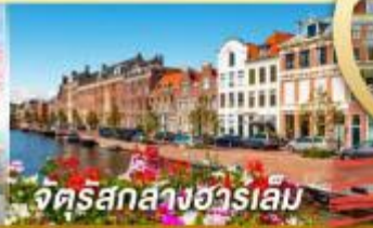
จัตุรัสกลางฮาร์เลม