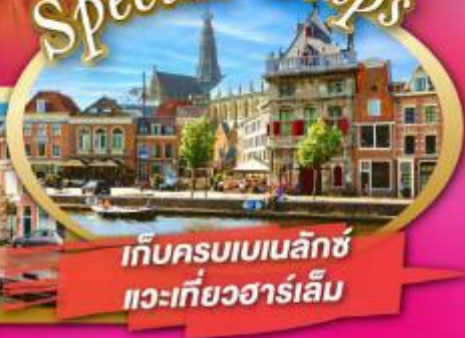
เก็บครบเบเนลักซ์ แวะเที่ยวฮาร์เลม