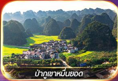
ป่าภูเขาหมื่นยอด